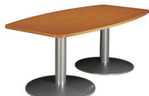
TABLE DE REUNION TONNEAU 100 cm / H 72 cm / L 200 cm - 6 personnes